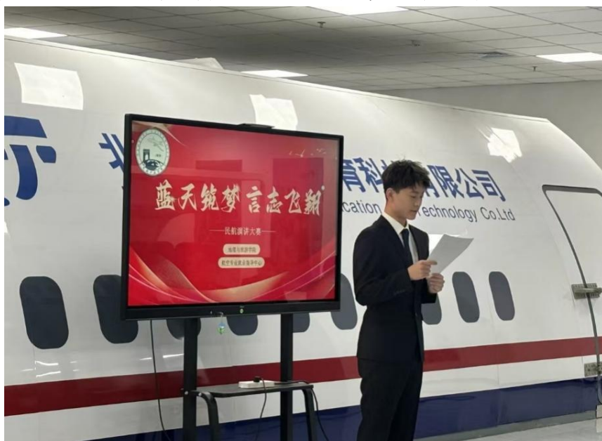
图 10 “蓝天筑梦，言志飞翔”演讲大赛现场

德育是五育之首，强调培养学生的道德品质和社会责任感。开展民航演讲比赛，弘扬社会主义核心价值观，培养学生的爱国主义精神、责任担当和顽强拼搏的精神，增强行业认同感。智育则注重培养学生的科学素养和创新思维能力。开展民航辩论赛，培养学生逻辑思考能力。体育旨在提升学生的身体健康和运动技能。通过形式多样，内容丰富的体育活动，进一步增强学生体质、磨砺学生意志，提升学生综合素质。美育则通过开展形象大使选拔活动，塑造学生“青春、时尚、健康向上”的精神风貌，提升学生的航空专业素养，给学生提供一个表现自我形象的舞台。劳动教育则让学生体验劳动过程，理解劳动价值，提升实践能力。