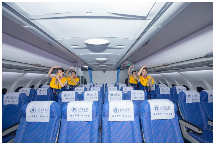
图 2 实训基地 A330 模拟舱实训区

学生能够在实践中更好地学习专业知识，提升技能水平，为未来的职业发展打下坚实基础。