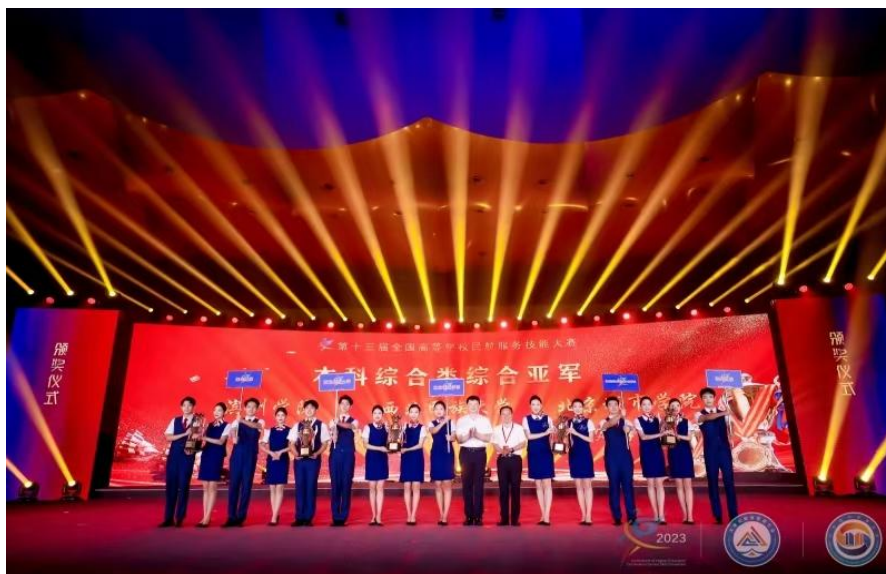
图 14 航空专业学生于全国民航服务技能大赛上获奖

军、亚军，并有多名学生荣获“形象大使”称号，很好地展现了学生们的优秀综合素质和专业技能。