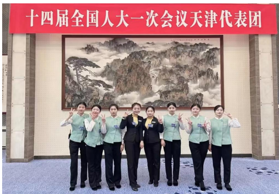
图 17 航空专业学生参与十四届全国人大会议服务保障任务