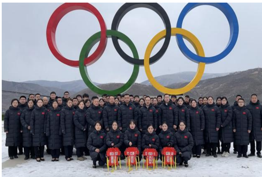
图 18 航空专业学生参与北京冬季奥运会服务保障任务

同时积极探索社会实践新模式，组织专项团队，让同学们在不同类型的实践中不断提升自己的综合素质和能力，传承和弘扬志愿服务精神，为社会贡献青春力量。