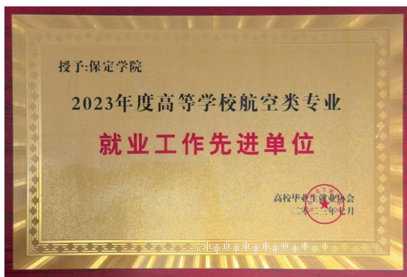
图6 我校获评高等学校航空类专业“就业工作先进单位”荣誉称号