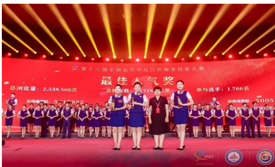
图 15 航空专业学生于全国民航服务技能大赛上斩获最佳人气奖

积极打造志愿服务教育平台，教育引导师生大力弘扬保定学院西部支教精神，积极服务国家和地方社会经济发展。五年来共派出 400 余人先后为全国两会、党的二十大、北京冬奥会、保定市旅发大会等重要活动进行支援保障，涉及了政治、体育、旅游等多个领域，使学生能够在不同领域、不