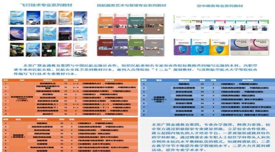
图 11 校企双方在教材建设取得的成绩

校企双方组建了由高校学者、民航业专家组成的编写团队，共同开发出具有行业特色的系列教材和教学资源，紧扣民航业高质量发展的建设需求，紧贴产教融合协同育人实际，建构了系统的应用理论知识体系。同时，该系列教材还借鉴了国际先进经验，具有较高的可读性和科普意义。目前，出版了航空服务艺术与管理、空中乘务等专业系列教材 30 册，包括《航空法律法规基础》《航空服务学》等。