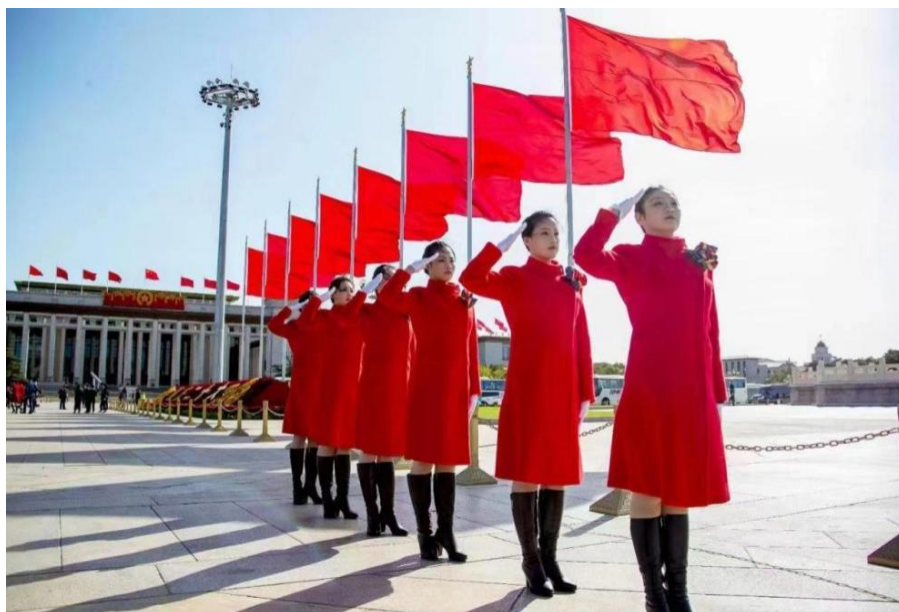
图 16 航空专业学生参与党的二十大服务保障任务

同岗位上获得宝贵的实践经验。多元化的实践经历拓宽了学生的视野，增强了实践能力和综合素质。