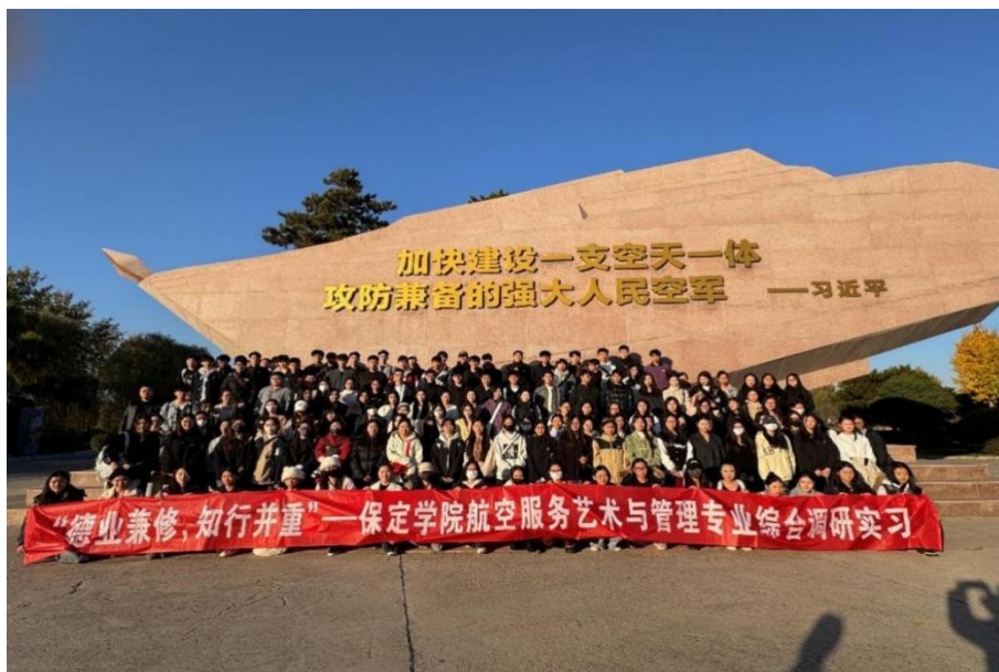
图 13 航空专业学生综合调研实践活动

民航现代产业学院充分利用学校的平台优势与企业资源优势，与企业共同开发了多项实践课程与项目，根据年级与学情特点，精心设计了递进式的系列专业实践教学活动，建设了近二十家实习基地，既为学生搭建起连接课堂学习与实践锻炼桥梁，同时还提供了深入探索专业内涵与未来职业路径的珍贵窗口，取得了显著成效。