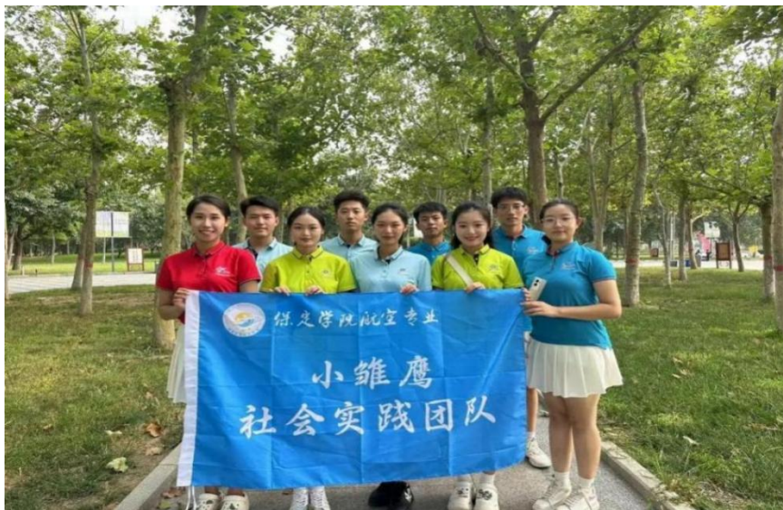
图 19 航空专业“小雏鹰”实践团队在西柏坡红色研学社会实践

未来，地理与旅游学院将积极深化民航现代产业学院建设，不断探索新的合作模式和运行机制，推动校企合作、产教融合向更深层次、更广领域发展，不断提升人才培养质量，为国家培养更多更优秀的德智体美劳全面发展的适应现代航空业发展需要的高素质应用型人才。