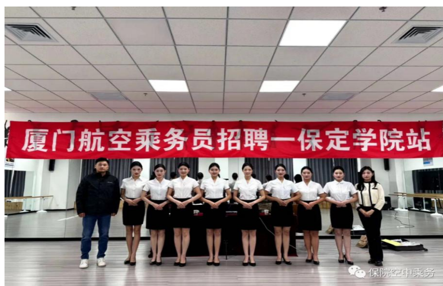
图9 厦门航空来我校航空实训基地设点招聘