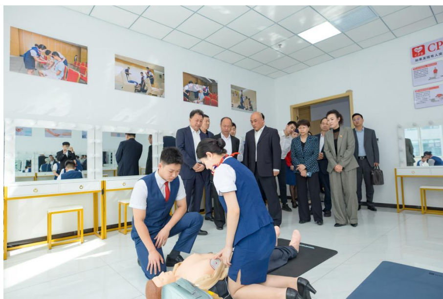
图 3 实训基地急救实训室

“嚶其鸣矣，求其友声”，民航现代产业学院通过“校企合作”积极搭建国内外高校合作交流平台，充分整合优质国际教育资源，促进师生对外交流、学习。航空专业师生共计 4 人次先后两次由北京广慧金通教育集团资助赴阿拉伯联