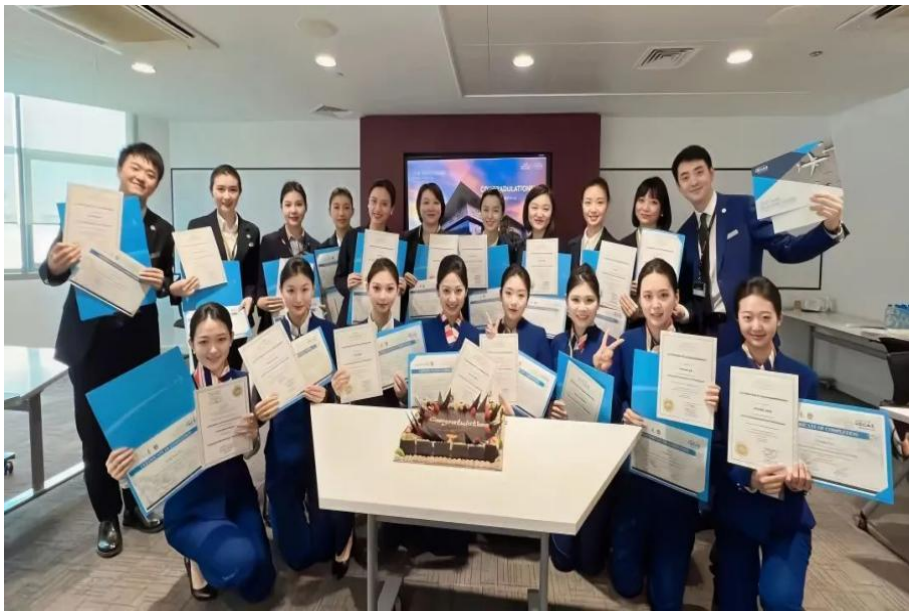
图 4 航空专业师生赴阿提哈德航空培训学院结业合影

合酋长国阿提哈德航空培训学院进行深入的专业学习培训。培训内容涵盖了机舱乘务员的整体安全、航空健康、客舱服务等专业知识，以及机组资源管理、飞行理论、机型特点、安全设备知识及应用、标准操作程序、航空卫生及医疗救护等核心课程。师生们以优异的成绩完成了高强度的培训，收获了丰富的知识和宝贵的经验，最终获得了由阿提哈德航空培训学院颁发的资质证书。