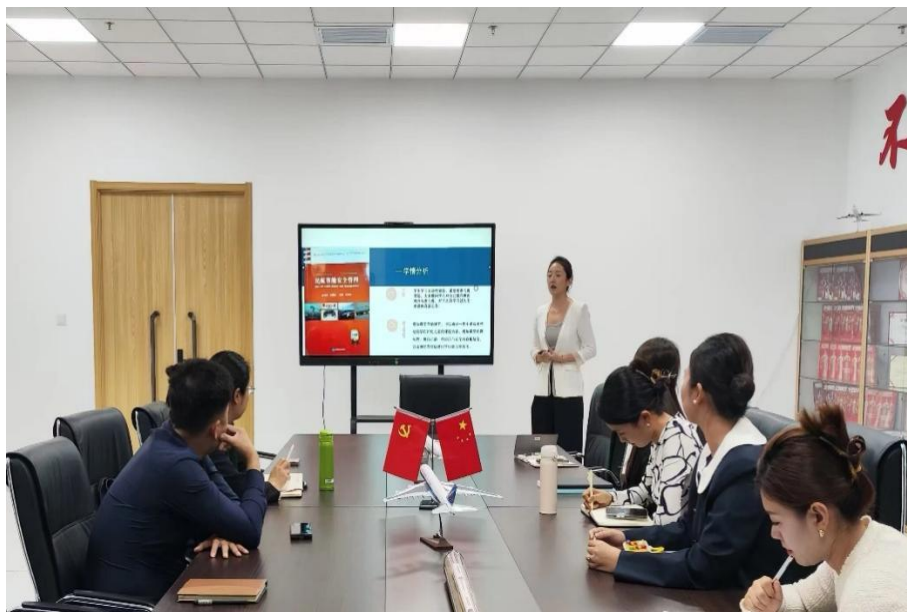
图 12 “双师双能型”专业教师说课活动

民航现代产业学院加强“双师双能型”教师队伍的外引内培工作，通过北京广慧金通教育集团引进了多名具备行业工作背景的优秀教师。同时，鼓励教师到企业实践锻炼和开展科研工作。在校内，每学期都进行听课说课活动以及教学技能培训。通过这些努力，打造了一支高素质、专业化的“双师双能型”教师队伍，目前“双师双能型”教师占比达 65.2%。