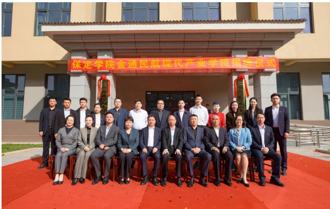
图1 保定学院金通民航现代产业学院揭牌仪式

民航现代产业学院为培养造就适应民航企业的高质量服务与管理人才,构建了优势互补、项目共建、成果共享的多主体参与、产学研融合的人才协同培养的合作办学模式,校企双方共同制定招生计划、录取标准和培养方案,确保学生入学时具备明确的职业发展方向、目标,使学生能够在校期间接触到贴近真实的行业环境和工作流程、提前适应职场生活,为未来职业发展奠定基础。