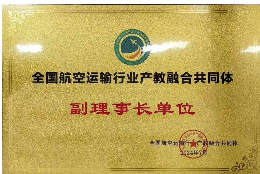
图8 我校为全国航空运输行业产教融合共同体副理事长单位

了学生在校期间就能与用人单位建立联系，了解用人单位的需求和期望，使学生能够有针对性地学习专业知识和技能，提升就业竞争力。目前成功引进中国南方航空股份有限公司、广西北部湾航空有限责任公司、厦门航空有限公司航空公司在内的三家航空公司在校设点招聘，极大地促进了在校生的高质量就业。