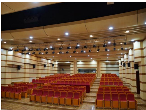
图 6 专业音乐厅

学院深入推动办学条件标准化、规范化建设，不断提高教学设施的建设、配备、管理及使用水平。音乐学专业现有音乐厅 1 个、各类实验实训室 89 个、学生琴房 140 间、录音棚、微型剧场、钢琴历史博物馆等，为学生的职业技能培养、校内实践教学提供了强有力的保障。