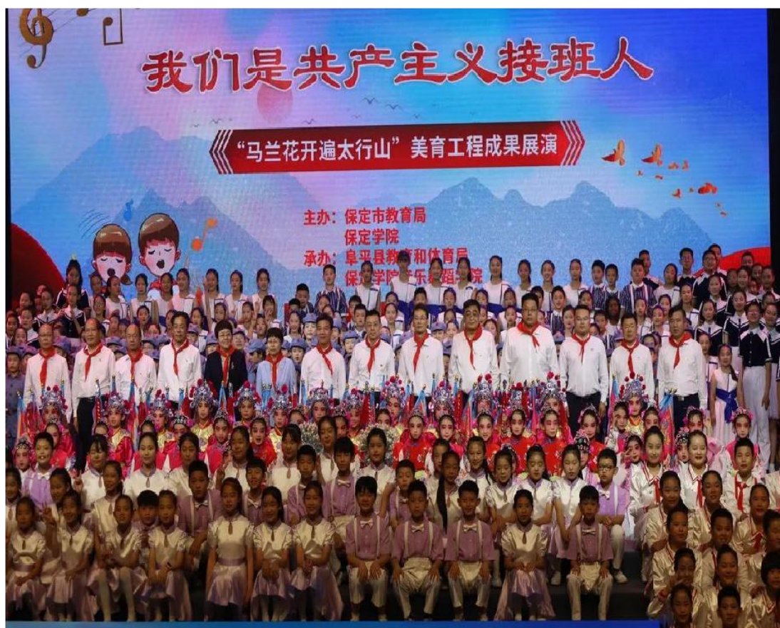
图 11 “马兰花开遍太行山”美育工程成果展演