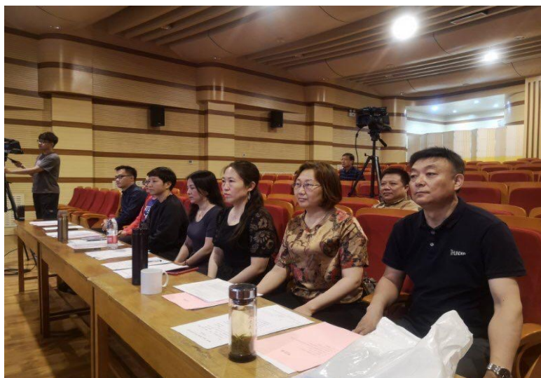
图 1 钢琴弹唱比赛

习主动性和创造性，形成“课堂-舞台-社会”闭环育人模式。四是实施技能小课“培优、提中、帮弱”分层教学模式，既保障所有学生共同的学习和发展需要，也充分满足学生个性化需求。五是科学扩大实践教学内容，学院每年定期举办学生教学基本功大赛，五月的鲜花合唱节，钢琴弹唱大赛、器乐比赛等专业赛事，锤炼学生艺术实践能力。六是构建了全面、多元、科学的考核评价体系，创新性地实施了“以赛代考、音乐会代考”等多元化考核方式，坚持过程与结果、理论与实践并重，促进学生知识、能力、素养全面提升。