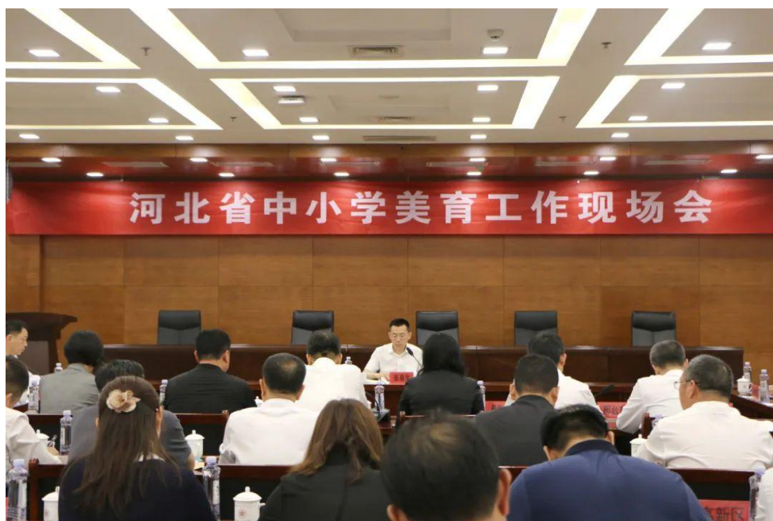
图 10 河北省中小学美育工作推进会

后奥运时代，学院秉承扎根基层、服务基层的理念，续写冬奥会辉煌，持续推进“马兰花开遍太行山”美育工程。学院选派7名教师赴太行山区教体局挂职工作，还有200名实习生，与当地教师共同开展教师培训、合唱展演等活动。活动覆盖了22个县（市、区），1996所中小学校，27992个教学班，近140万名学生，真正实现了“班班有歌声、校校有活动、县县有展演”的局面。此次活动是近年来河北省规模最大，参与人数最多的音乐美育教育活动，获得了河北省教育厅通报表扬，并向全省推广这一经验，此工作也受到中央教育工作领导小组秘书局有关领导的肯定，其成功经验要进一步向全国范围推广。