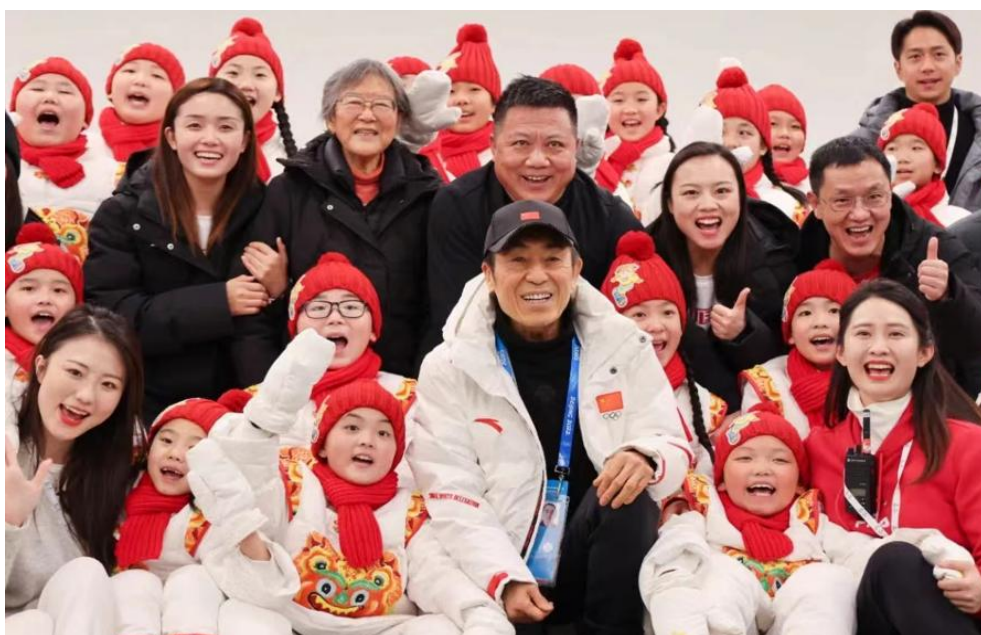
图 9 学院教师团队与赵小兰女士、张艺谋导演合影