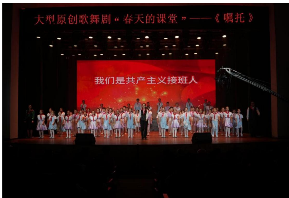
图 5 大型原创歌舞剧“春天的课堂——《嘱托》”