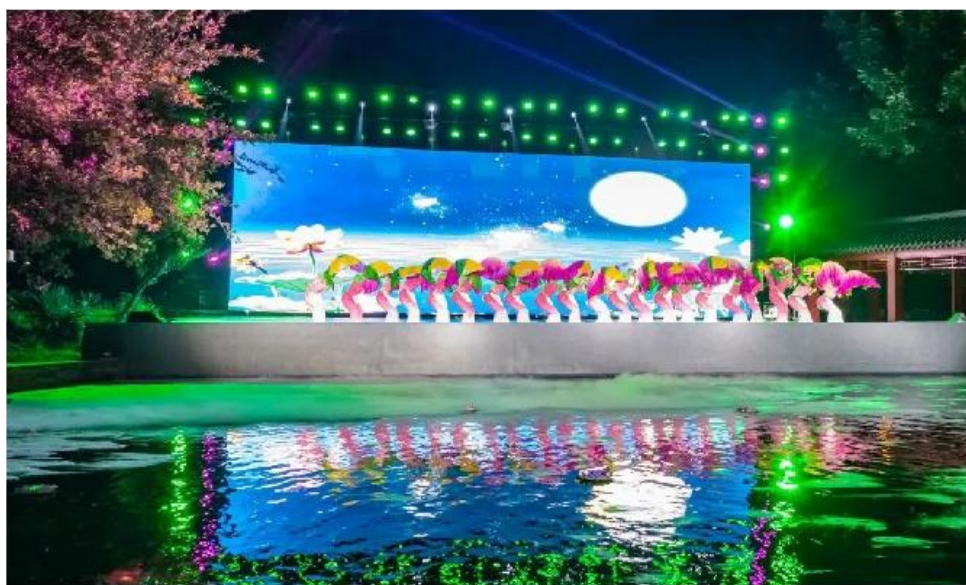
图 4 保定学院廉洁文化演出

生动展现保定学院西部支教毕业生群体扎根在边疆、育人在边疆、奉献在边疆的感人事迹，深情展示了燕赵大地人民教师的拼搏进取精神。这些实践成果支撑了人才培养方案，加强了实践教学，创新了教学思路，坚定了学生的职业理想。