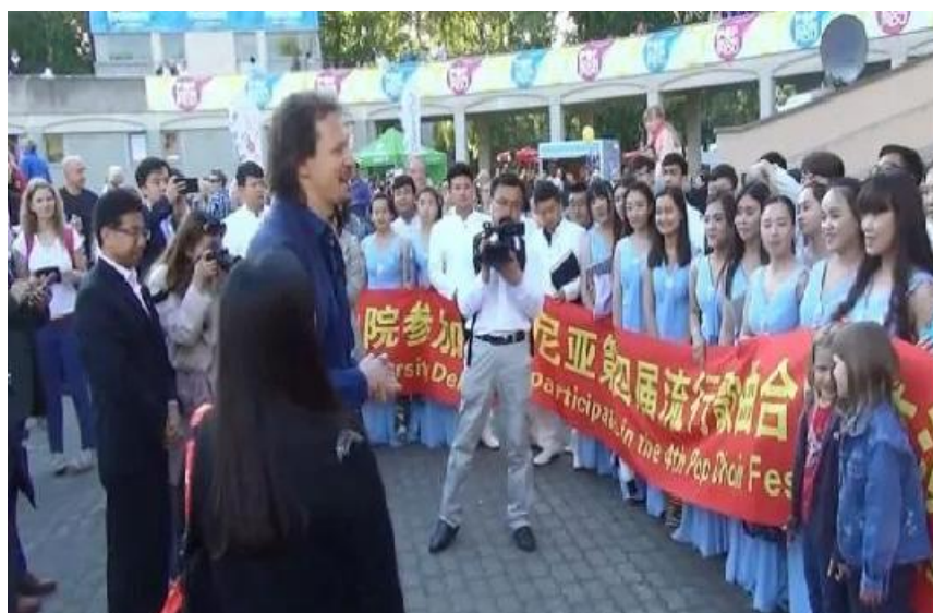
图 14 学院合唱团赴爱沙尼亚交流演出

学校思想政治教育工作先进集体”“河北省模范职工小家” “河北省高等学校先进基层党组织”“保定市宣传文化系统先进集体”多项荣誉。