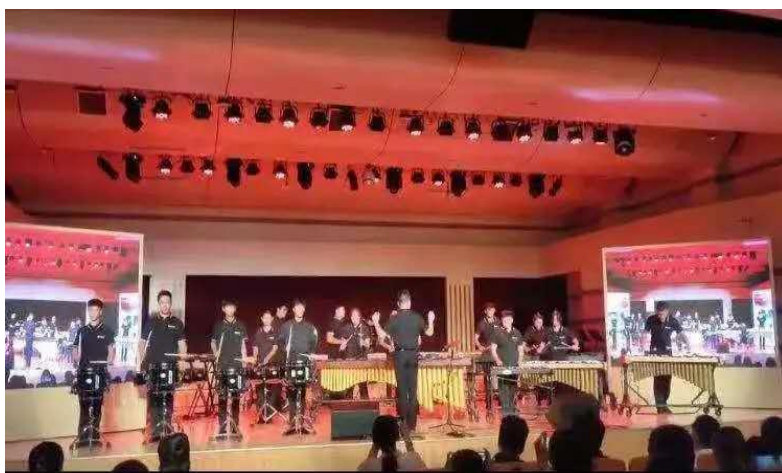
图 2 专业技能表演