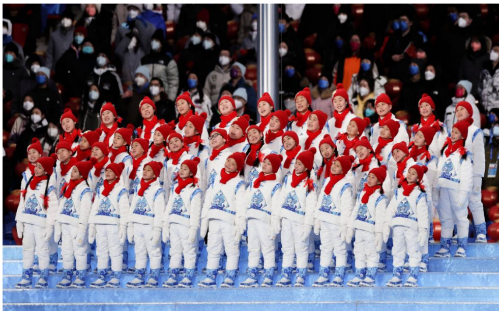
图 8 2022 年助力阜平马兰花童声合唱团参加北京冬奥会开闭幕式

孩子们带着泥土的芳香，用天籁之声唱响奥林匹克颂，震撼了全世界，被张艺谋导演誉为我们创造了音乐的奇迹。这不仅展现了孩子们的才华，也体现了学院的教育教学水平以及服务社会、助梦未来、扎根基层、教书育人的职业理想。未来，学院将继续用音乐传递爱与希望，为更多基层孩子搭建梦想的舞台。