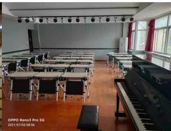
图 7 微型情景剧场