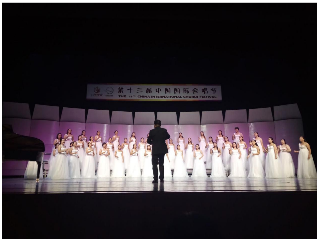
图 13 学院合唱团参加第十三届中国国际合唱节

时代的音乐之美让生命绚丽多彩——“马兰花开遍太行山”美育工程实施经验与反思》获得全国第七届大学生艺术展演活动高校美育改革创新优秀案例一等奖，彰显了我们的创新能力与社会影响力。