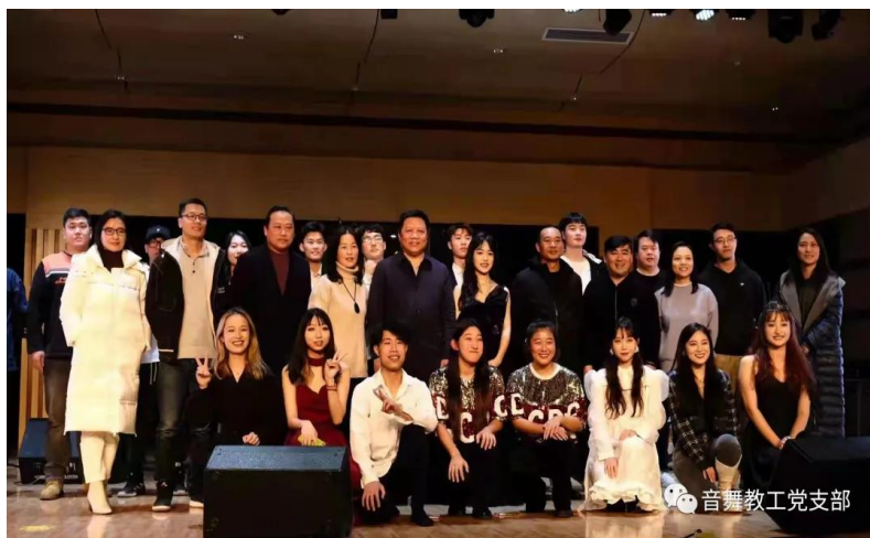
图3 声乐培优生专场汇报演出