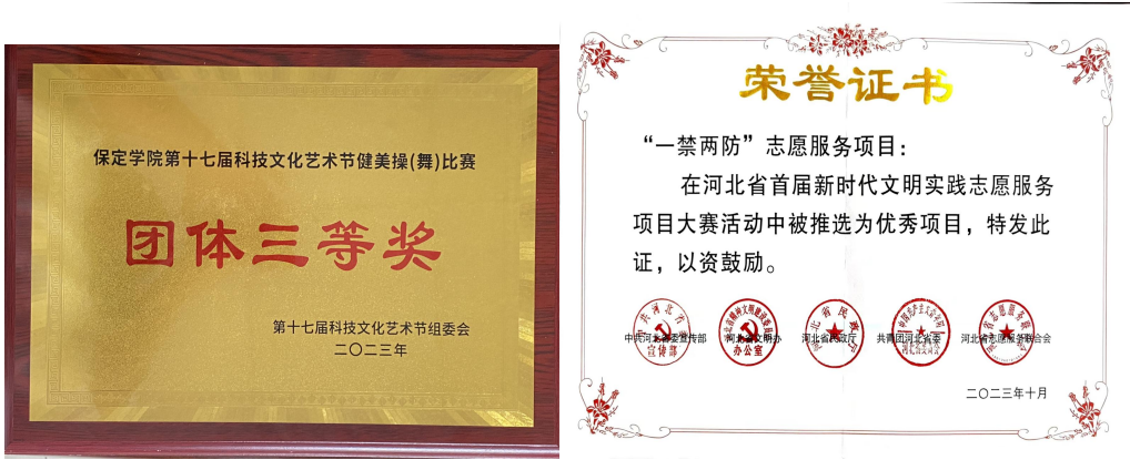
图 3 学生活动获奖证书

学院高度重视学生综合实践与创新能力的培养，始终坚持把提高人才培养质量作为创新创业教育的出发点和落脚点，全力打造“专创融合”人才培养模式，促进专业教育与创新创业教育有机融合。