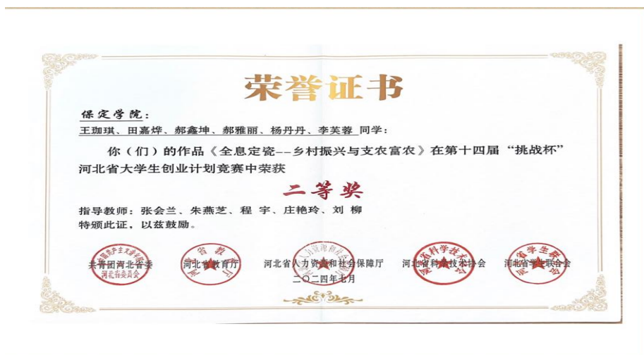
图 4 学生参加省级大学生创业计划竞赛获二等奖