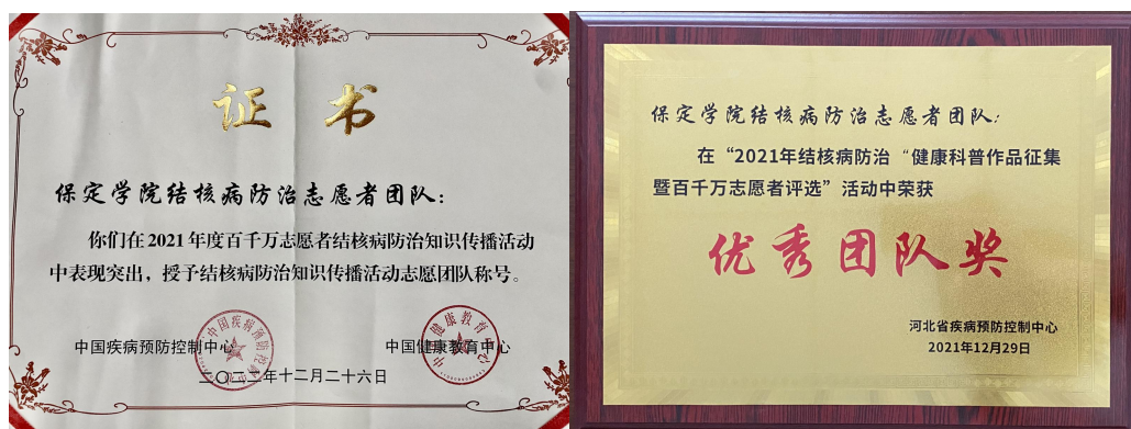
图 5 学院品牌志愿服务荣获国家级奖项