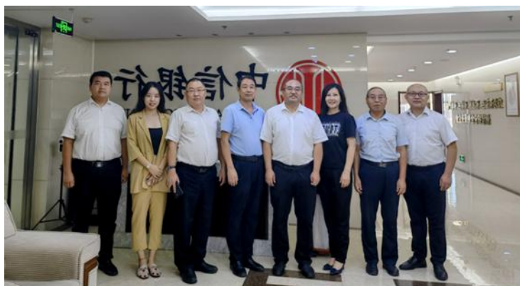
图 1 党总支带领投资学专业和中信银行建立校企合作

学院积极探索“党建+”工作模式，将党建工作与专业建设、课程思政、社会实践等紧密结合，形成了一批具有特色的党建品牌项目。秉承“一基、二带、三融合”育人措施，如“党建+产教融合”项目，通过搭建校企合作平台，实现党建工作与企业文化的深度融合，有效提升了专业工作的针对性和实效性。