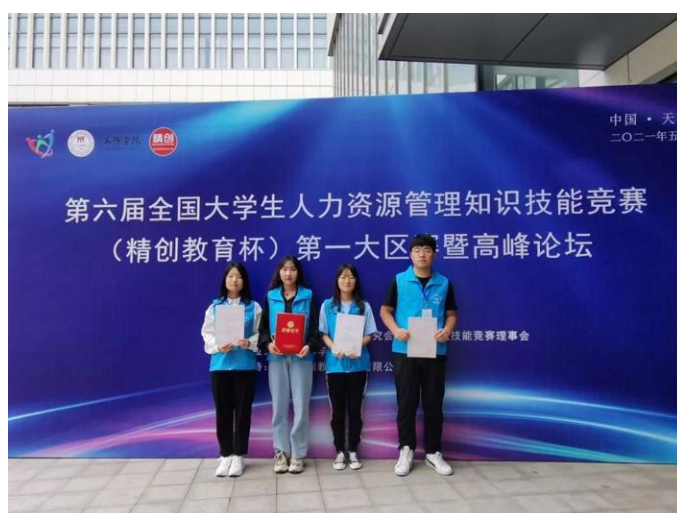
图 2 人力资源管理知识技能竞赛获奖

依托 3+实践体系，建立见习实训+学科竞赛、校内+校外、学校+企业的 3+实践体系。见习实训中增加学科竞赛内容，以赛促学、以赛促教，加深专业知识理解。