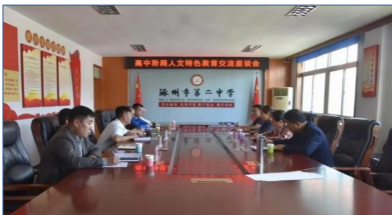
图 4 与涿州二中结成帮扶单位

文学院充分挖掘地域文化资源，拓展特色实践育人路径。多年来不断加强与保定市域及雄安新区等学校、企事业单位的深度合作，为学生提供优质的实习平台、充足的实习机会，助力学生实践能力全方位提升。