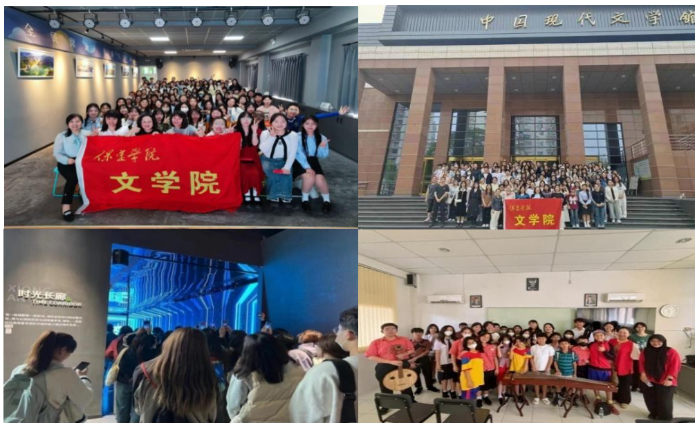
图 6 丰富多彩的专业见习研习实习活动