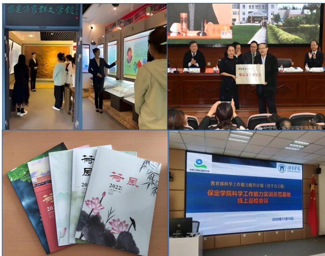
图2 文学院实践教学平台