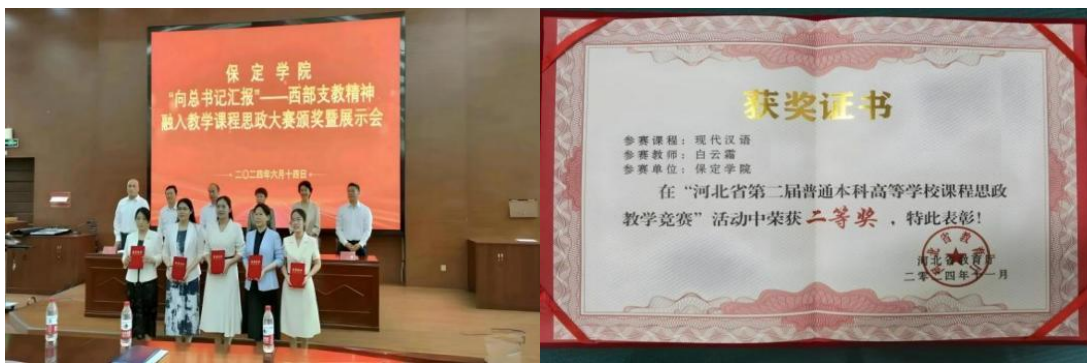
图 1 学院教师多次在省、校级课程思政大赛中获奖