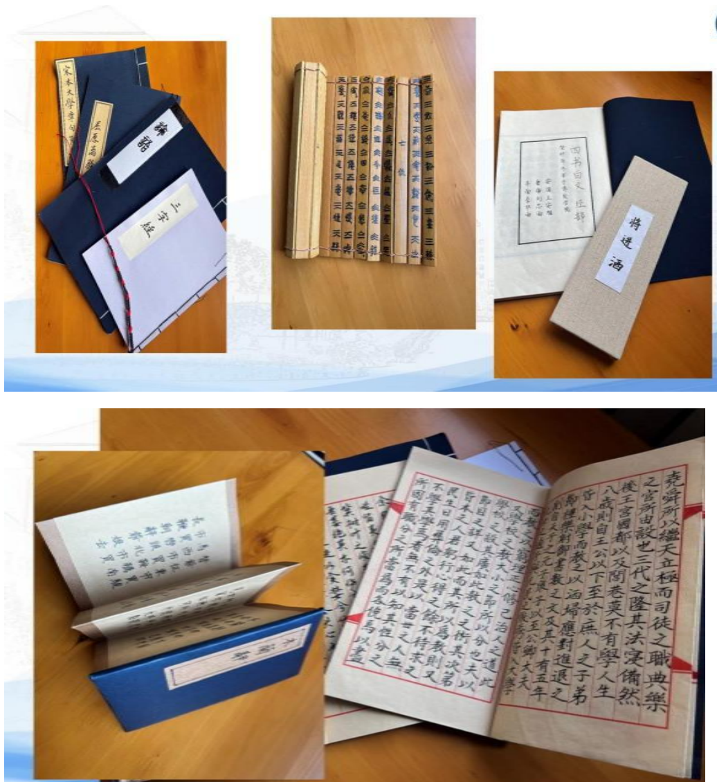
图 7 学院创新教学成果