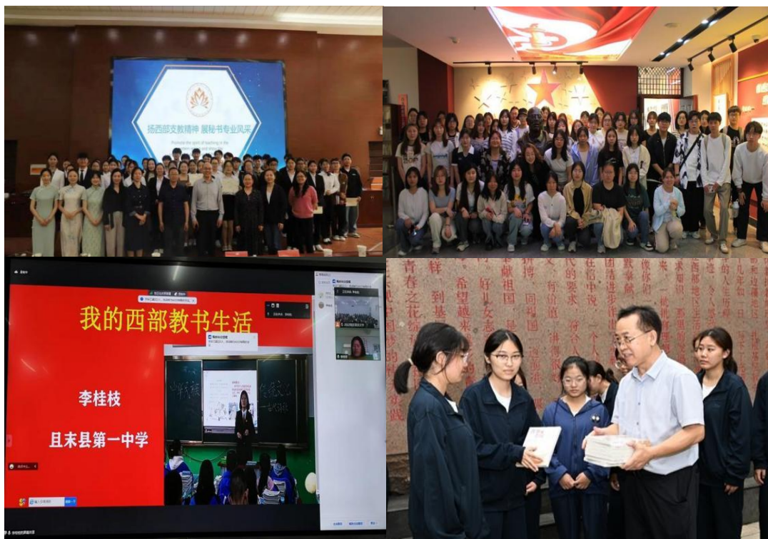
图 3 校本文化活动