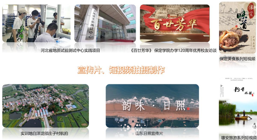
图 17 师生视频作品

助力地方文化建设。2019 年，与保定市委网信办共建全国首家校政网络管理执法宣传教育中心，运维“保定网信管理执法”公众号，为网络生态治理贡献力量，并荣获“清朗保定·燕赵净网 2021”先进集体称号。