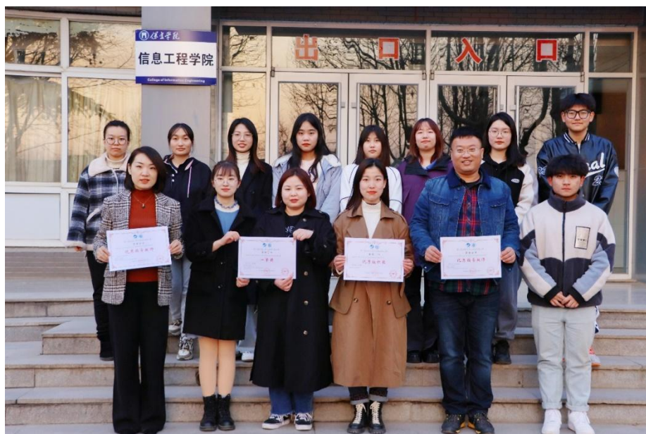
图 14 学生参加第二届全国大学生采购实践大赛