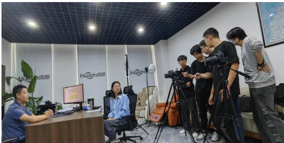
图 10 学生参与宣传片拍摄