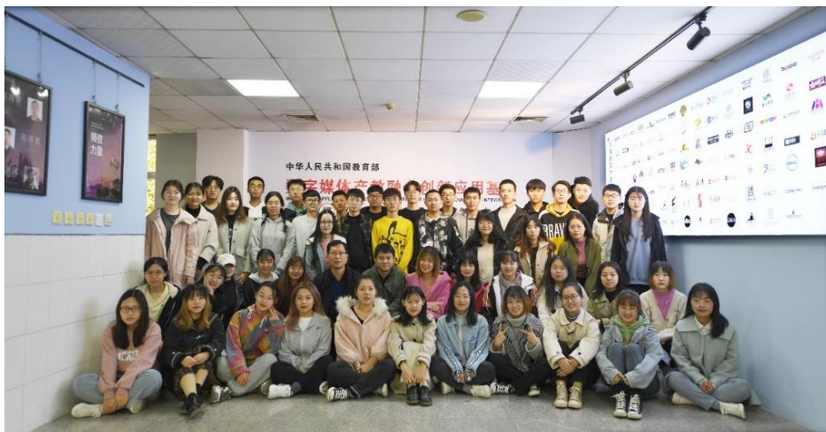
图 12 企业教师进校授课合影