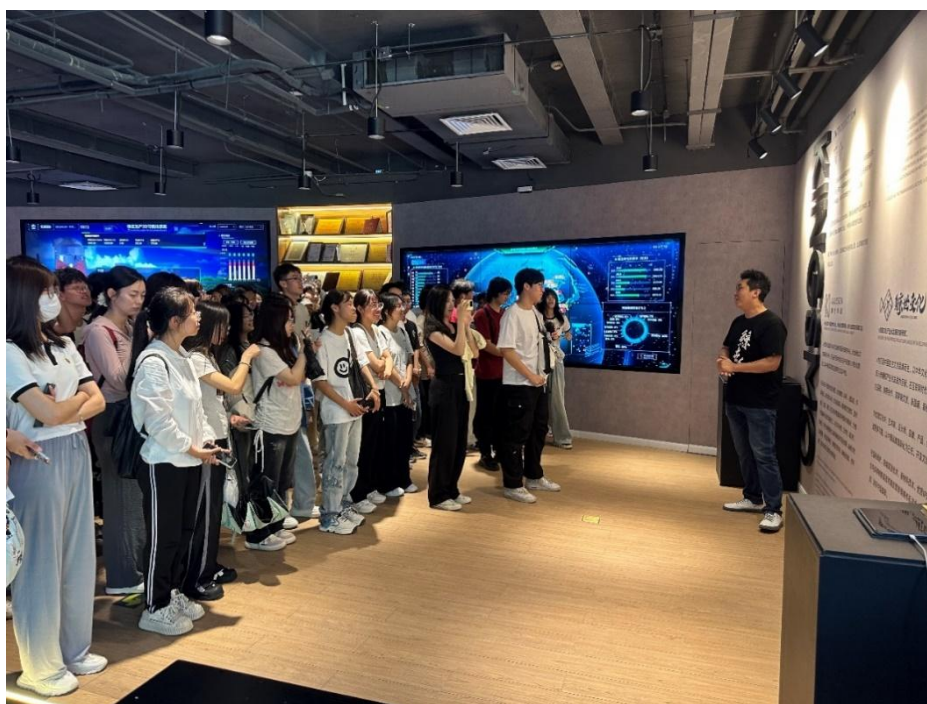
图 11 数字媒体技术专业赴实习基地参观学习

作为教育部首批“高校数字媒体产教融合创新应用示范基地”试点专业，秉承“校企合作，产教融合”的核心理念，通过引入企业师资、项目等方式，构建了完善的产学研体系，专注于培养数字资产、虚拟现实及影视动画等领域的创新型人才。