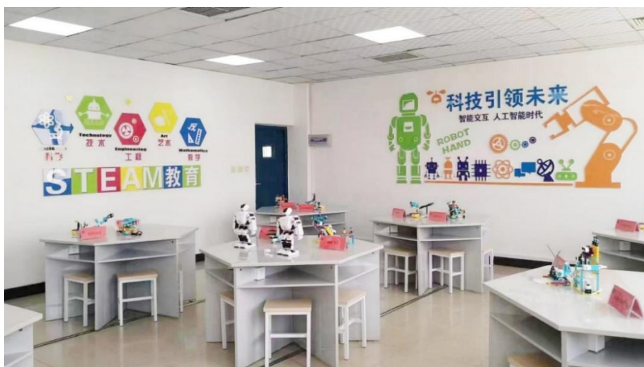
图 5 Steam 教育实验室

2024 年 10 月，通过教育部普通高等学校师范类专业第二级认证。秉承 OBE 教育理念，遵循“夯基础，强技能”的原则，实施“六个一”项目化教学，全面提升学生数字化资源开发、信息化教学系统设计及人工智能教育能力，打造人工智能教育特色。