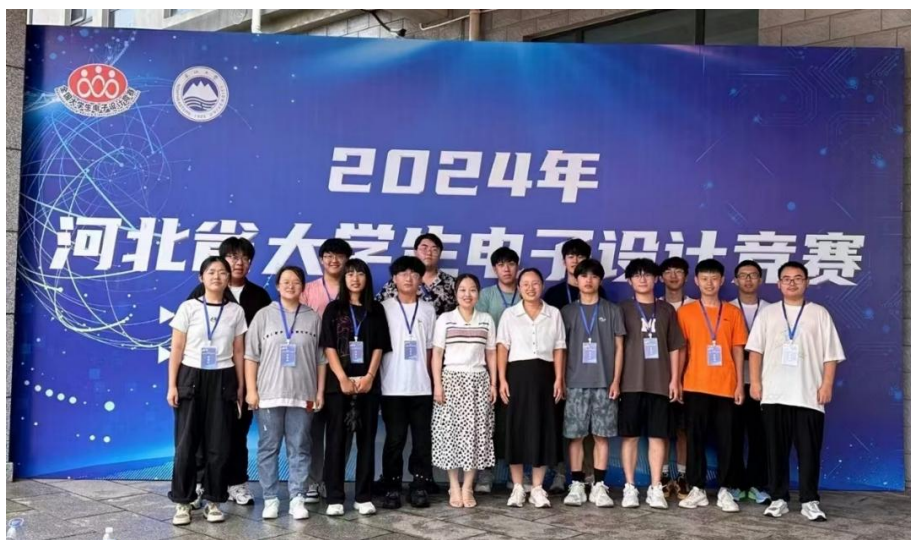
图 8 学科竞赛