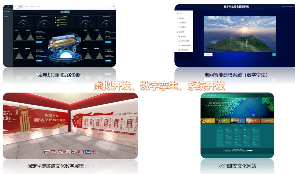
图 18 师生开发项目