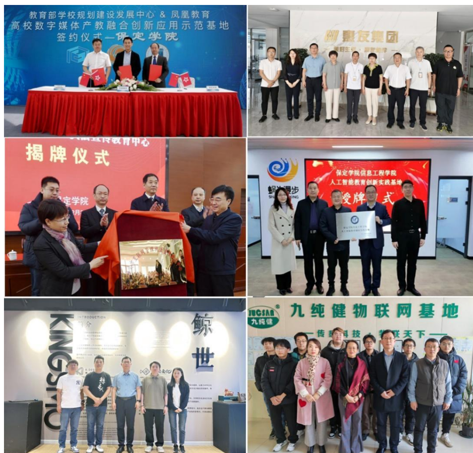
图 3 探索产教深度融合人才培养路径

学院依托“高校数字媒体产教融合创新应用示范基地”“保定网信管理执法”校政共建平台及自主创立的“米心传媒工作室”“智能硬件工作坊”融媒体中心等实践基地,打造专业实践与思政教育深度融合的新模式。专业教师与高年级朋辈导师携手,与凤凰教育、保定日报新媒体中心、雄安新区融媒体中心、唐尧网、水润雄安网站、顺丰速运、惠友集团、蜗牛漫步科技公司等行业企业的项目合作,通过项目教学、行业浸润、运营实战、联合研发等多元化模式,拓宽学生实践视野,实现课程与职场需求的无缝对接,培养高素质应用型人才。