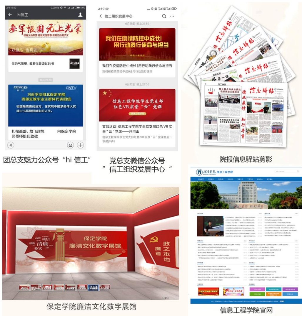
图 4 学院新媒体矩阵

学院重视思想政治工作，融合“融媒体+党建”创新模式，打造“两微一网一馆一纸媒”数字化新场景，利用微信公众号“信工组织发展中心”“Hi 信工”、学院网页、“廉洁文化数字展馆”和“信息驿站”报等新媒体矩阵，以潜移默化的方式传递理想信念、正确价值观与家国情怀，深化师生理想信念和社会主义核心价值观教育。同时，强化“以党建带团建”，通过青年大学习等形式，培养学生社会责任感与纪律意识。鼓励学生参与公益实践，实现德智体美劳全面发展，展现学院独特育人风采。