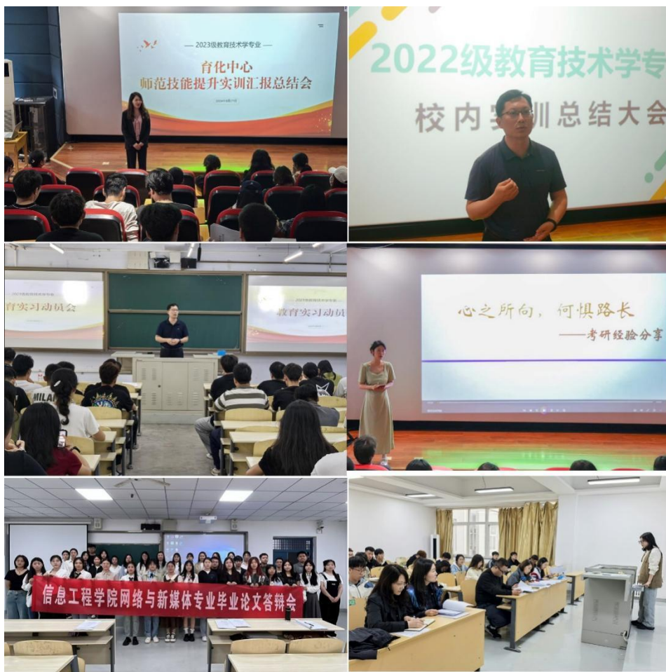
图 2 教学活动