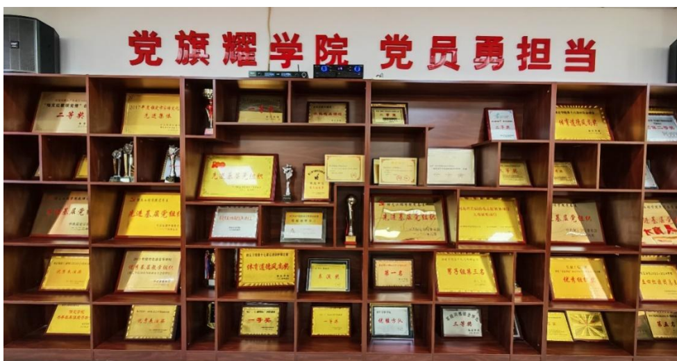
图 16 学院荣誉墙