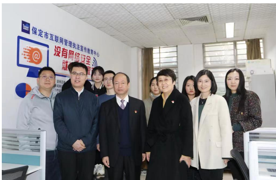
图 9 保定市互联网管理执法宣传教育中心

获批河北省一流本科专业建设点,河北省普通本科院校优秀教学团队,河北省高等学校优秀基层教学组织。《视听语言》课程立项为省级在线精品开放课程,《微视频创作》立项为省级课程思政示范课程,《网络新媒体编辑》立项为省级本科一流课程。2019 年底,保定市委网信办和保定学院联合成立了全国首家地市级校政共建网络管理执法宣传教育中心,学院组建师生团队,为保定市委网信办运维“保定网信管理执法”公众号,为保定市网络生态治理贡献力量。