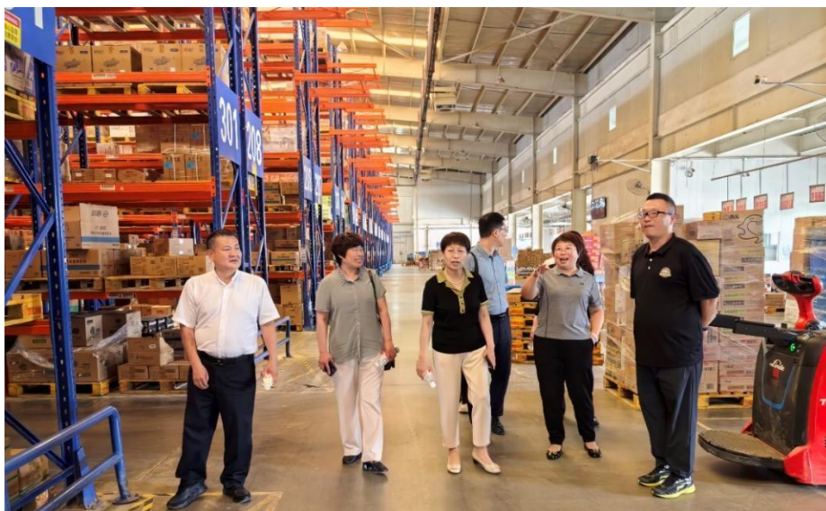
图 13 赴惠友集团物流中心专业调研

精准锚定就业市场的脉搏，专注于培育智慧物流方向的高素质应用型人才。与顺丰集团、长城集团蚂蚁物流、保定惠友集团等物流及流通行业的领航者深度合作，将课堂知识与实际岗位需求紧密相连，实现了课程与职场需求的无缝对接。