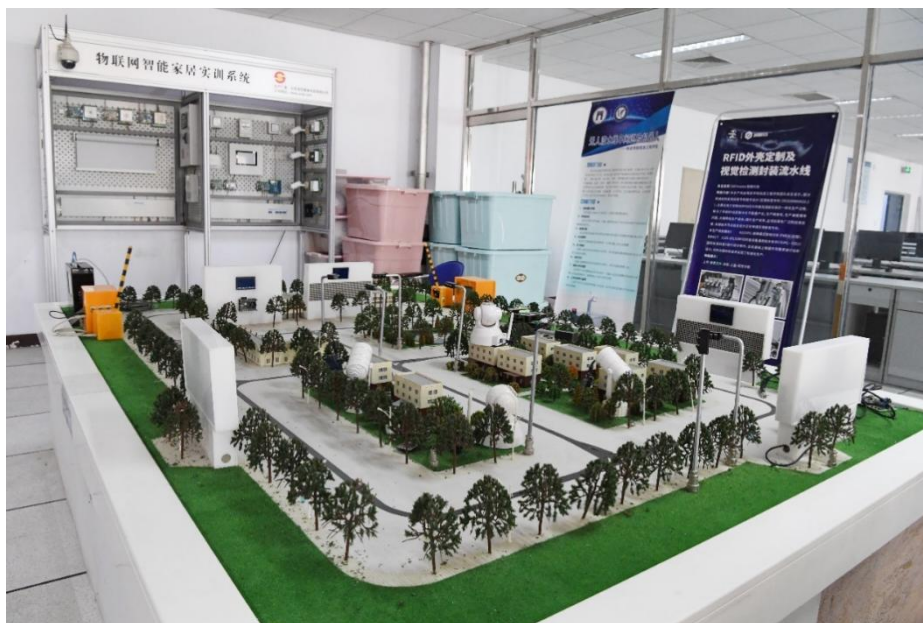
图 7 物联网智能实训系统平台

获批河北省一流本科专业，河北省高等学校优秀基层教学组织，河北省普通本科高校应用型转型示范专业。专业设有智能硬件工作坊，孵化学生创新项目，有效提升学生综合技能和创新能力。学科竞赛战绩辉煌，累计获奖 251 项，其中国家级 168 项。