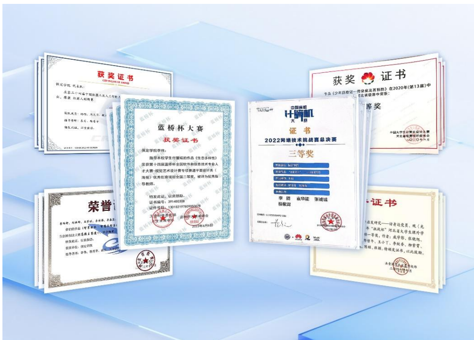
图 15 学科竞赛获奖证书