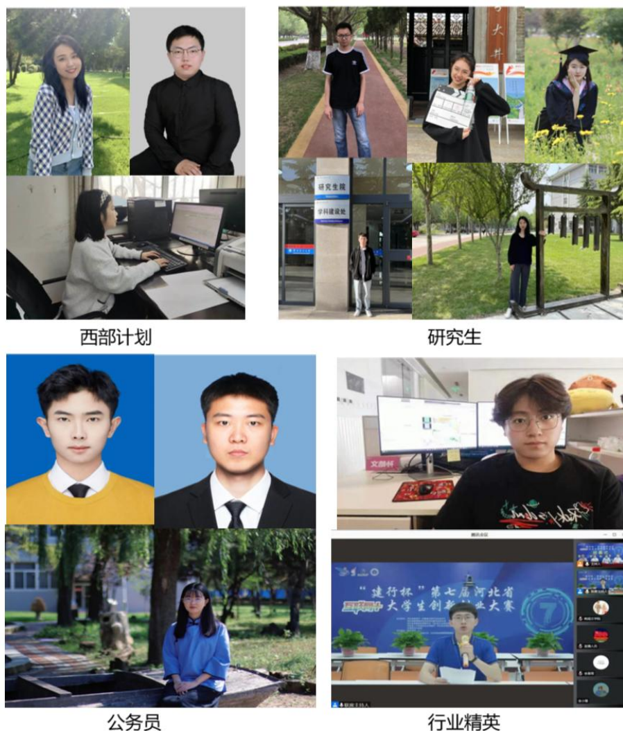
图 19 优秀毕业生

学院的毕业生就业质量稳步提升，毕业生凭借扎实的专业知识、出色的实践能力和卓越的职业素养，赢得了用人单位的广泛赞誉与高度认可，充分展现了学院人才培养的丰硕成果。部分毕业生成功考入北京师范大学、华东师范大学、天津大学、中国海洋大学、西南交通大学、华北电力大学等众多知名高校进行深造，部分毕业生凭借出色的专业技能和综合素质，顺利入职中国移动、搜狐畅游、杭州泰联科技、京东、顺丰等知名企业。